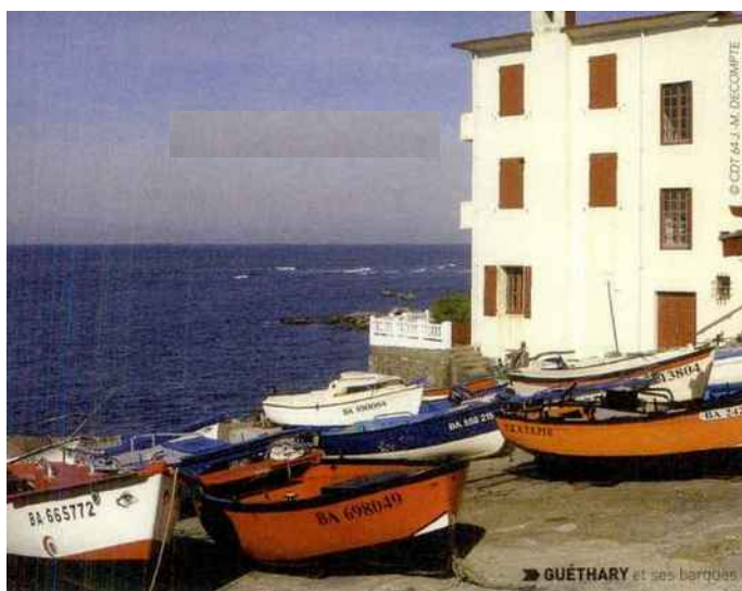
➤ GUÉTHARY et ses barques