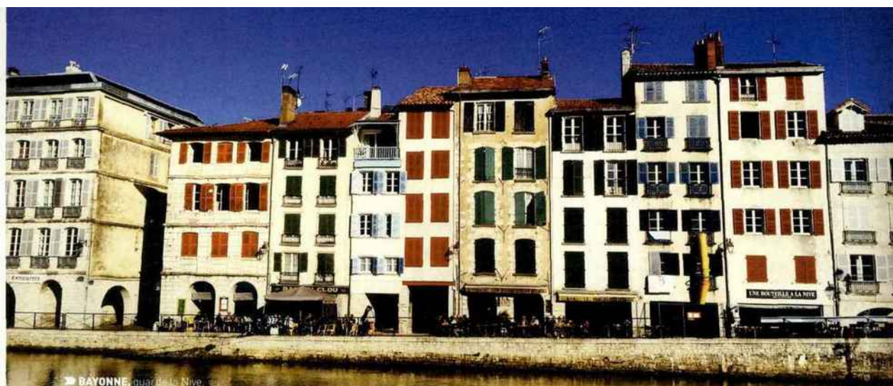
► BAYONNE, quai de la Nive.

▶ blanche au Pays basque. Ils avaient envie de pratiquer leur sport favori et ont donc incité quelques riches Britanniques à investir dans le Golf du Phare qui ouvre ses portes le 13 mars 1888. En 1893, un second golf voit le jour à Saint-Jean-de-Luz mais il sera malheureusement effacé par la Seconde Guerre Mondiale. Mais le golf de la Nivelle, lui, sera aménagé à Ciboure. Les deux golfs les plus célèbres, Chiberta à Anglet et Chantaco à Saint-Jean-de-Luz naissent en 1927 et 1928, séduisant les Français les plus aisés. Dans les années 80, le golf s'ancre encore un peu plus dans le Pays Basque avec la création de quatre nouveaux parcours : Arcangues, Makila, Ilbarritz et Epherra. Vue mer ou vue Pyrénées, avec des links en bordure d'Atlantique ou tournés vers l'arrière-pays, les golfs