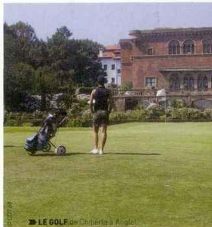
➤ LE GOLF de Ciberta à Anglet

Plus bas s'étend la baie de Saint-Jean de Luz, l'une des plus belles de la côte atlantique. Autrefois village de pêcheurs, la cité est restée préservée et son front de mer aligne hôtels Belle Époque et maisons basques. Trois digues y freinent les ardeurs de l'Océan, Socoa avec son fort construit par Henri IV, l'Artha et Sainte Barbe. Le centre-ville, lui, et en particulier la rue Gambetta, regorge de boutiques de produits locaux : espadrilles, toiles du Pays basque, charcuteries, chocolateries, fromageries, et les pâtisseries avec le fameux gâteau basque nature ou fourré à la cerise. Un régal. Place Louis XIV, les grands cafés accueillent les badauds fatigués autour d'un kiosque central. Quelques artistes peintres y exercent leurs talents. C'est à Saint-Jean-de-Luz que le roi Louis XIV épousa en 1660 Marie-Thérèse, fille du roi d'Espagne. Quelques kilomètres plus bas, de l'autre côté de la baie, c'est Ciboure avec son