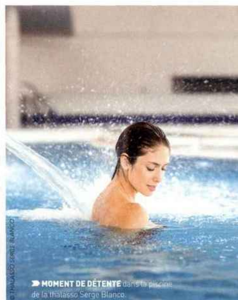
► MOMENT DE DÉTENTE dans la piscine de la thalasso Serge Blanco.

EN 1956, UN SCÉNARISTE AMÉRICAIN DÉBARQUE À BIARRITZ POUR TOURNER UN FILM. DANS SES BAGAGES UNE PLANCHE DE SURF. LA MODE ÉTAIT LANCÉE.